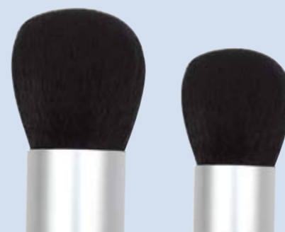
large KB 919 Ø 30 mm small KB 899 Ø 25 mm

Kabuki made of black synthetic hair extremely soft. Perfect for applying powder, rouge or mineral make-up