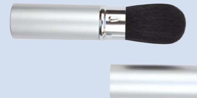
PB 949 Gesamtlänge 10 cm (geschlossen) Total length 10cm

Handbag rouge brush extendable, silver cap, essential for every purse, super soft, synthetic hair, black