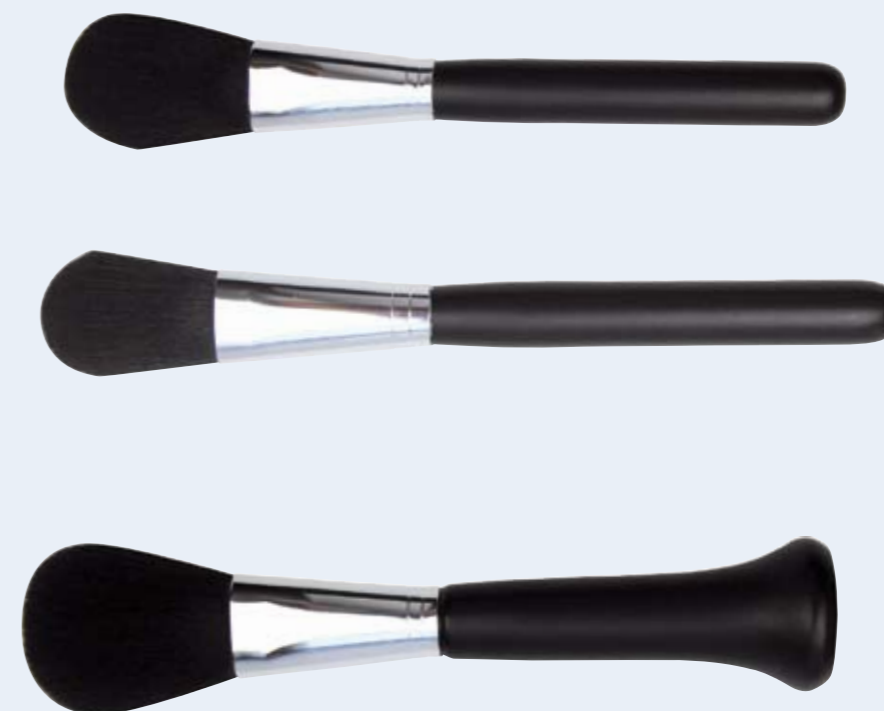
Alternativ mit Ziegenhaar Alternativ with goat hair PB 915