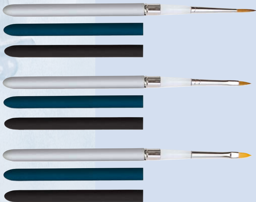
EB 309 Eye-Liner echt Rotmarder Eye-liner pure red sable schwarz black V1 blau blue V2 silber silver

with a newly developed soft-touch-cover, in black, blue, silver. Acrylic middle part