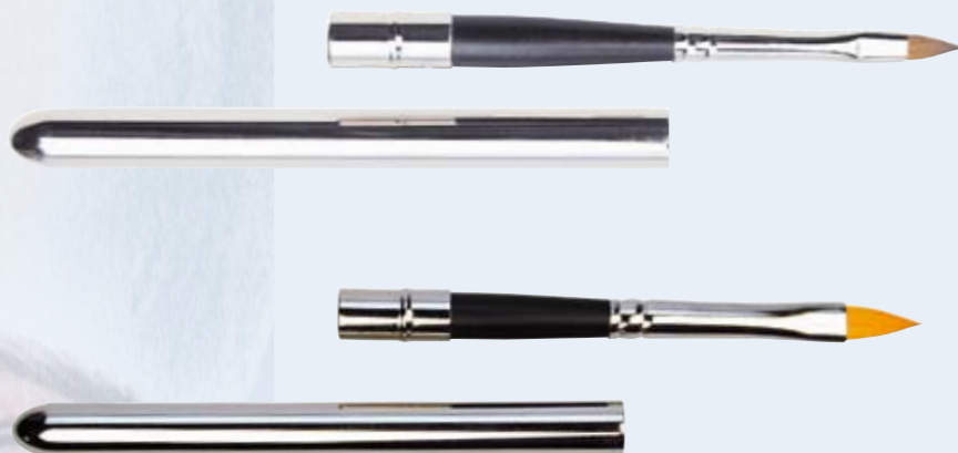
LB 38 Lippenpinsel spitz gearbeitet, echt Rotmarder Lip brush pointed shape, pure red sable

Professional cosmetic brushes for handbags. Lip brush with metal cap, silver. Middle part black dulled or acrylic transparent